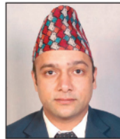
नरहरी पौडेल मुमहि शाखा