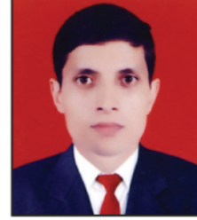
मुबन प्रसाद पन्थ लेखा तथा कोष