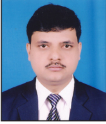
गोपाल खनाल कानून