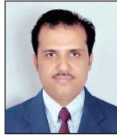
बुद्धि जीवन मुसाल सन्धिखर्क शाखा